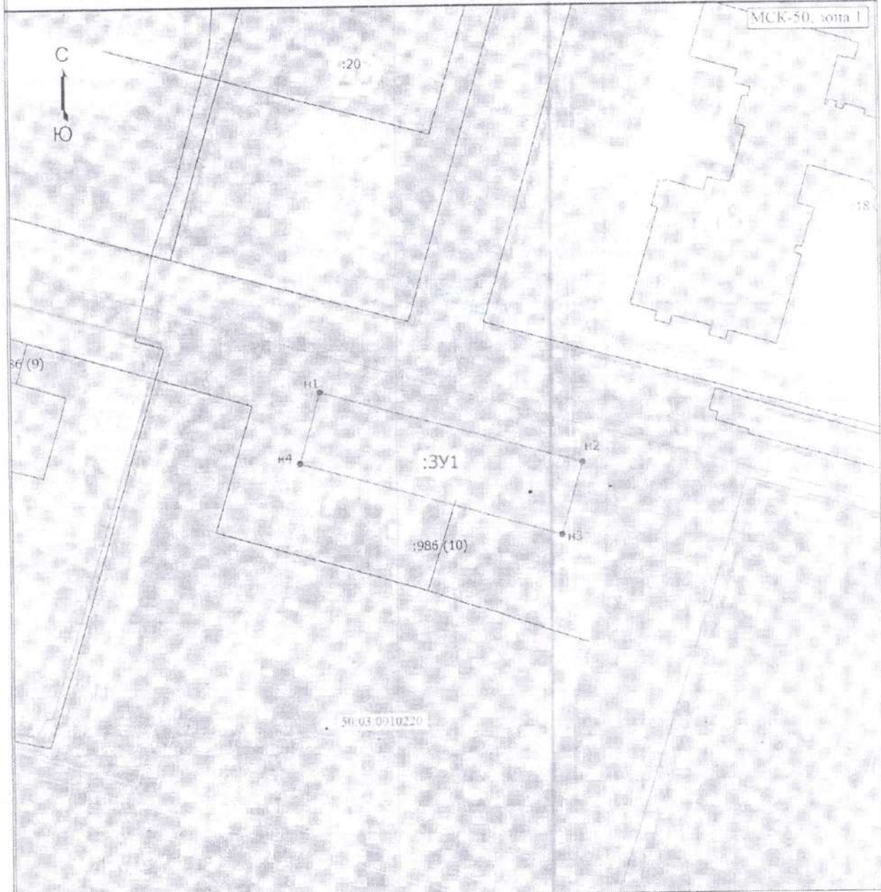
Схема расположения земельных участков