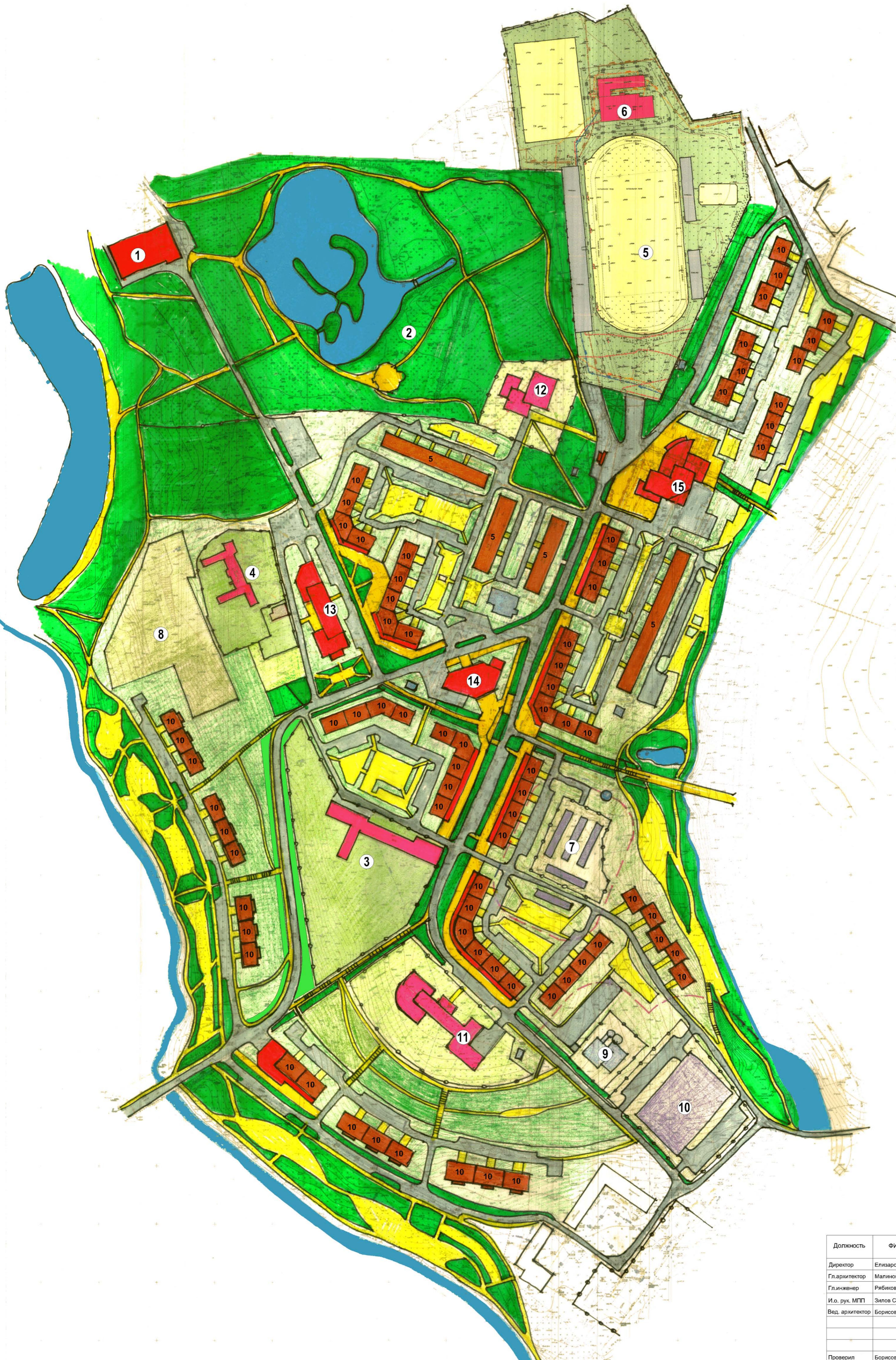
Схема архитектурно-планировочной организации территории (вариант 2)