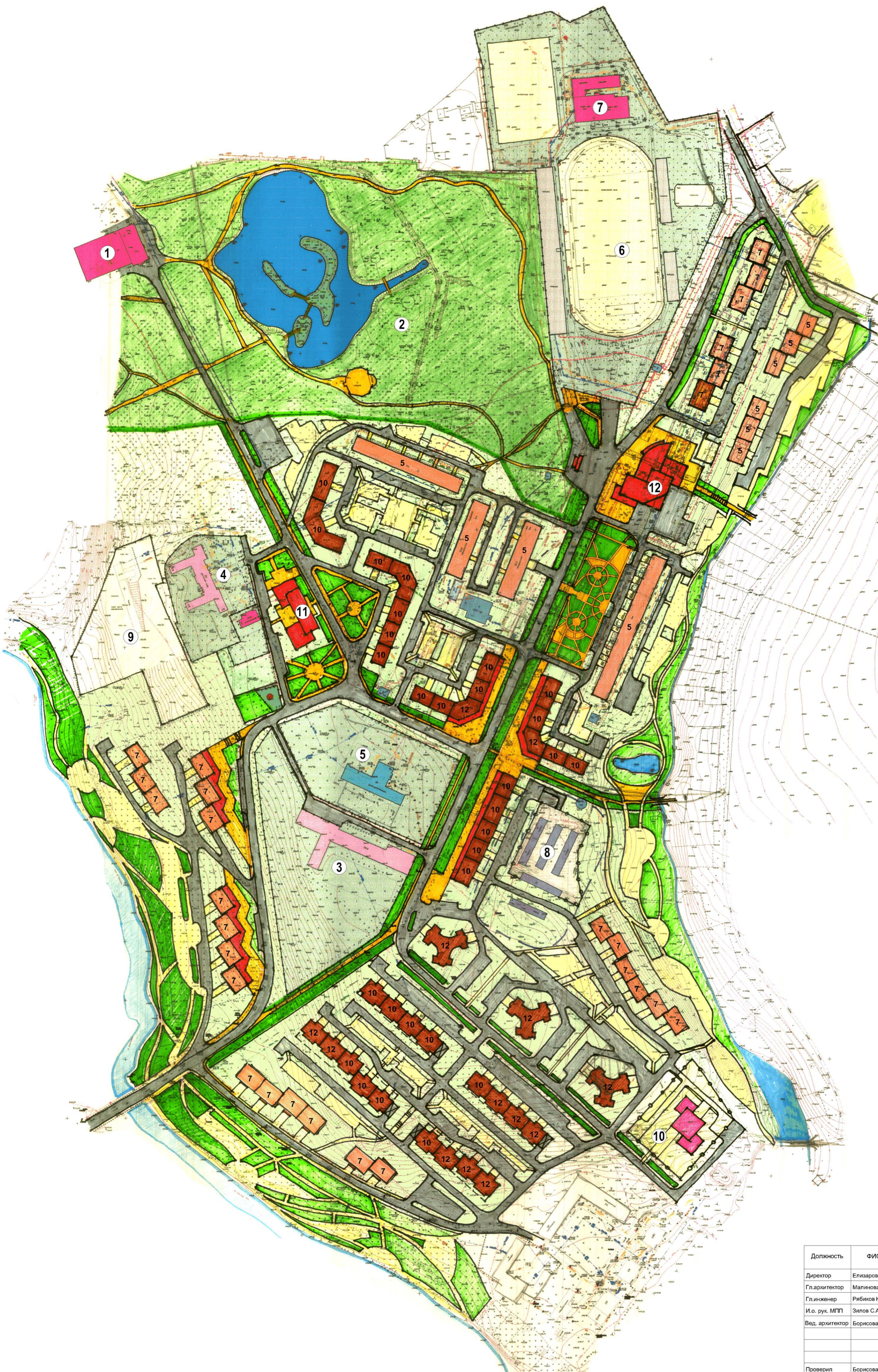
Схема архитектурно-планировочной организации территории (вариант 1)